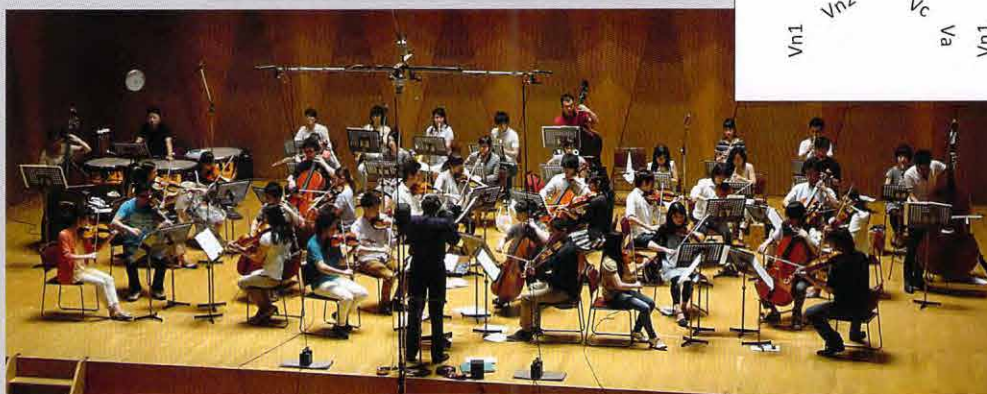
「英雄」の収録風景 半円形のフルテット6組を全面2列に配置