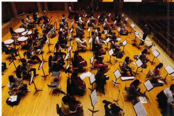
←チャイコフスキーの収録風景